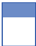
1/3 de página (horizontal) 20,5 x 9,5 cm