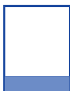
Rodapé 20,5 x 5,0 cm