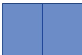
página dupla 41,0 x 27,5 cm