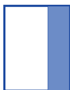
1/3 de página (vertical) 7,0 x 27,5 cm