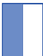
1/2 página (vertical) 10,0 x 27,5 cm