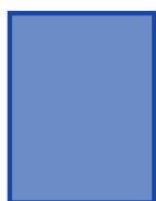
página inteira 20,5 x 27,5 cm